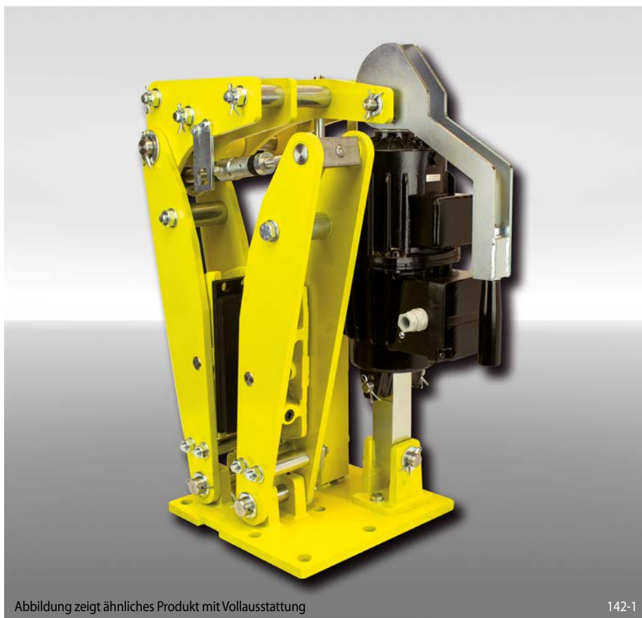
Abbildung zeigt ähnliches Produkt mit Volllausstattung

federbetätigt – elektrohydraulisch gelüftet