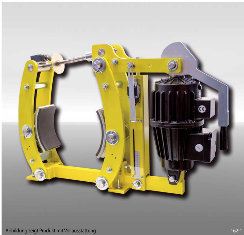
Abbildung zeigt Produkt mit Volllausstattung

federbetätigt – elektrohydraulisch gelüftet Trommelbremse nach DIN 15 435