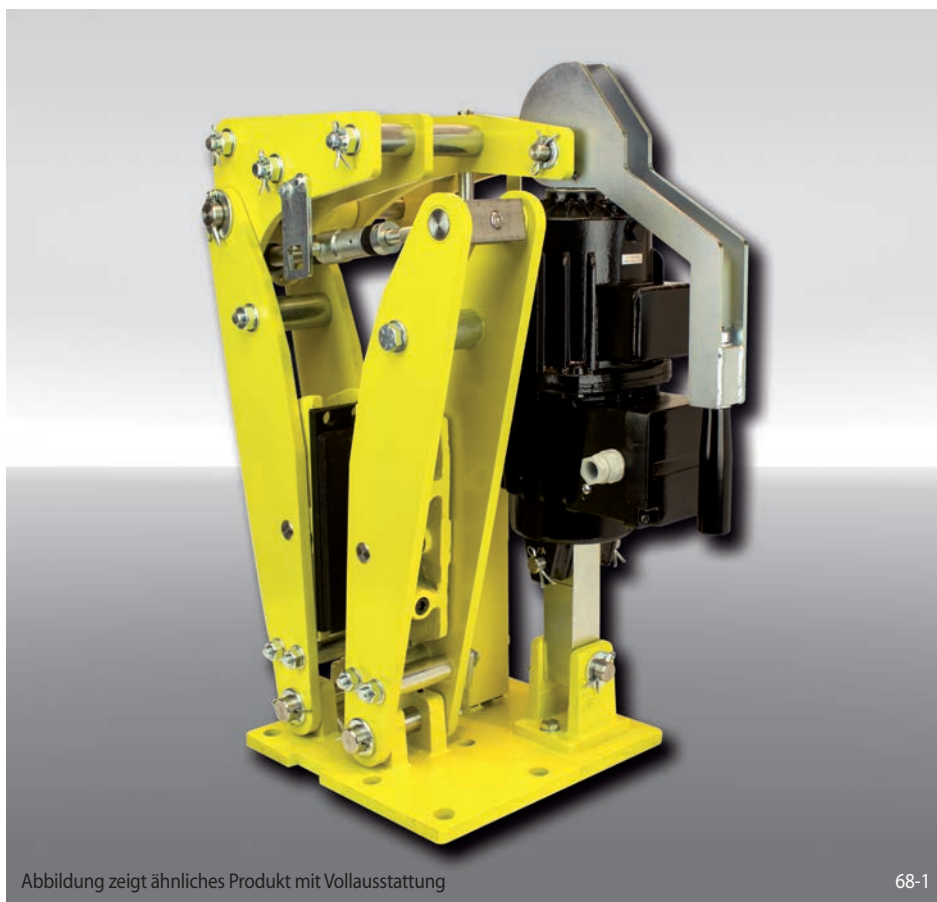
Abbildung zeigt ähnliches Produkt mit Vollausrüstung

federbetätigt – elektrohydraulisch gelüftet