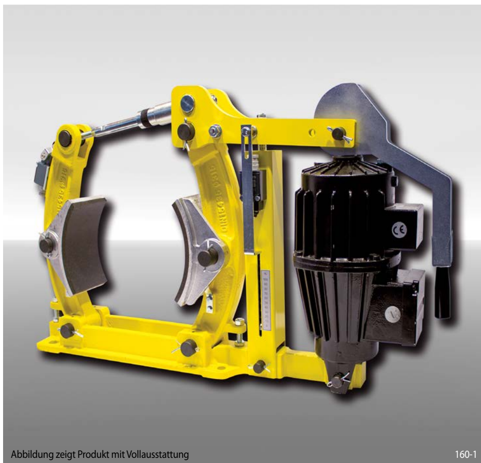
Abbildung zeigt Produkt mit Volllausstattung

federbetätigt – elektrohydraulisch gelüftet Trommelbremse nach DIN 15 435